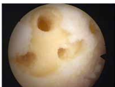
Umschriebener Knorpeldefekt nach Mikrofrakturierung (zur Bildung eines Ersatzknorpelgewebes)

Die Operation ist ambulant durchführbar, es besteht jedoch prinzipiell die Möglichkeit einer Übernachtung in unserer Einrichtung (Bettenstation), ggf. als Selbstzahlerleistung.