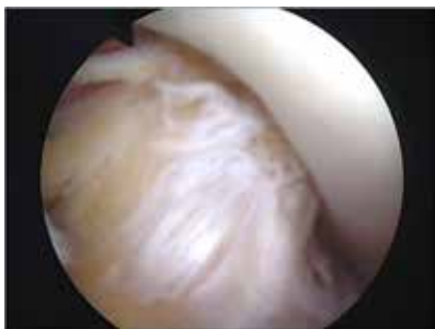
frische vordere Kreuzbandersatzplastik mit (Quadrizepssehne)

Die Operation ist ambulant durchführbar, es besteht jedoch prinzipiell die Möglichkeit einer Übernachtung in unserer Einrichtung (Bettenstation), ggf. als Selbstzahlerleistung.