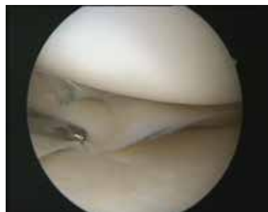
nach durchgeführter Naht